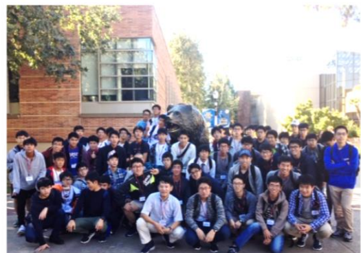
UCLAのキャンパス見学

11月2日(土)～8(金)の期間に、高校2年生は海外大学企業連携研修を行いました。背世界のトップ大学の一つであるカリフォルニア大学ロサンゼルス校(UCLA)で現地学生と交流やディスカッションを行ったり、NASAのジェット推進研究所や、ハリウッドを見学したりしました。グローバル化が進む中、英語で積極的にコミュニケーションをとる力を身につけることができました。自分の可能性を信じて大きな視野をもってほしいと思います。