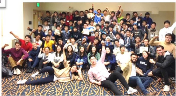
修了証書もらった後の記念撮影