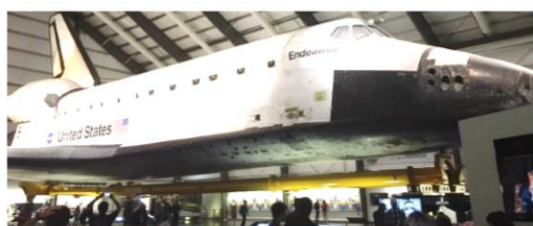
カリフォルニア科学博物館