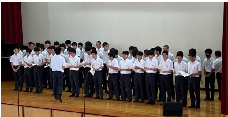
▲ 高校1年生による合唱