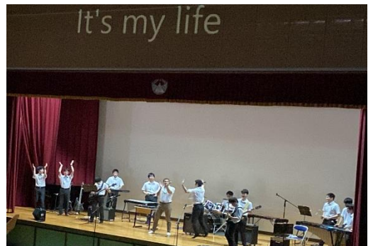
▲ 音楽部による演奏